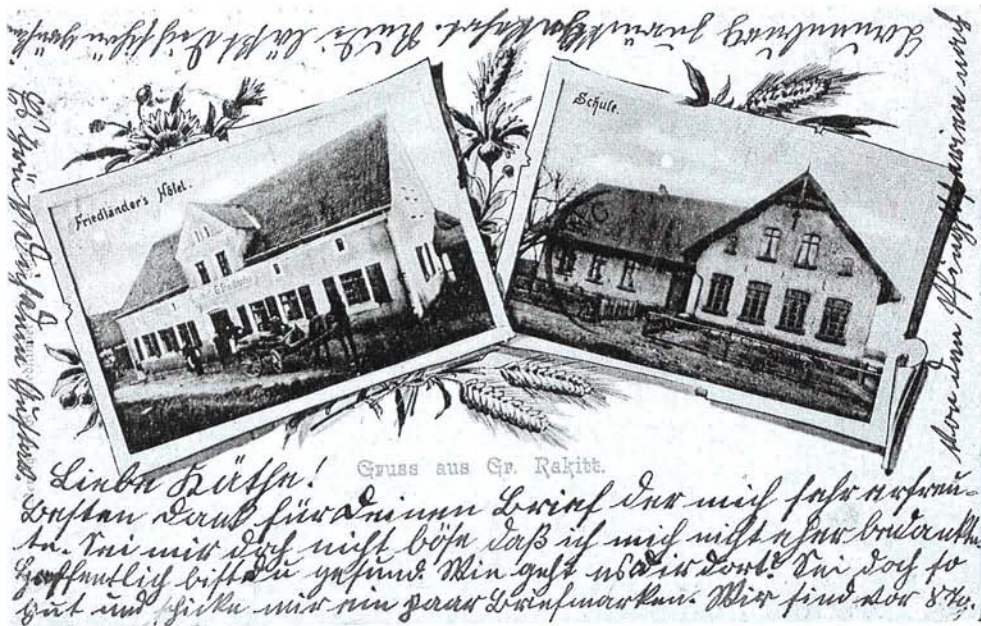
Groß Rakitt um 1900 – Gasthof und Schule

Das Kirchspiel Groß Rakitt hatte 1940 sechs eingepfarrte Ortschaften mit insgesamt 1455 Gemeindegliedern. Eingepfarrt waren Groß Rakitt, Hohenlinde (Bochowke) mit Gliesnitz, Klein Rakitt, Mühlenthal (Wottnogge) mit Seeblick (Saviat) und Eichen (Dambee), Neurakitt und Bochow im Kreis Lauenburg. Das Patronat war staatlich. Die Besetzung der Pfarrstelle erfolgte nach dem Pfarrerwahlgesetz. Groß Rakitt gehörte als Kirchspiel zum Kirchenkreis Stolp-Altstadt. Die Dorfbevölkerung war evangelisch. 1925 gab es einen Bewohner katholischer Konfession (0,2 v. H.) und vier Juden (1,0 v. H.).